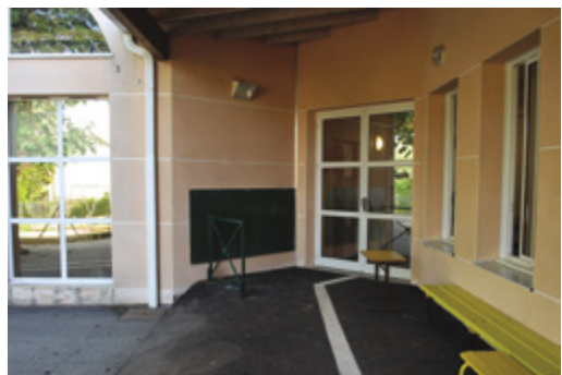
Dans les écoles : bande podotactile au pied des escaliers et rampe d'accès