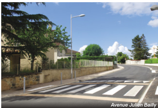
Avenue Julien Bailly