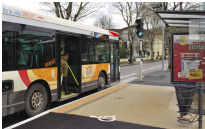
Arrêt « Maison de la Formation »

Lancé début 2016, le volet « transports urbains » de l'Ad'AP s'est terminé en 2022 avec la mise en accessibilité et la sécurisation de l'arrêt central des Jardins de l'Hôpital.