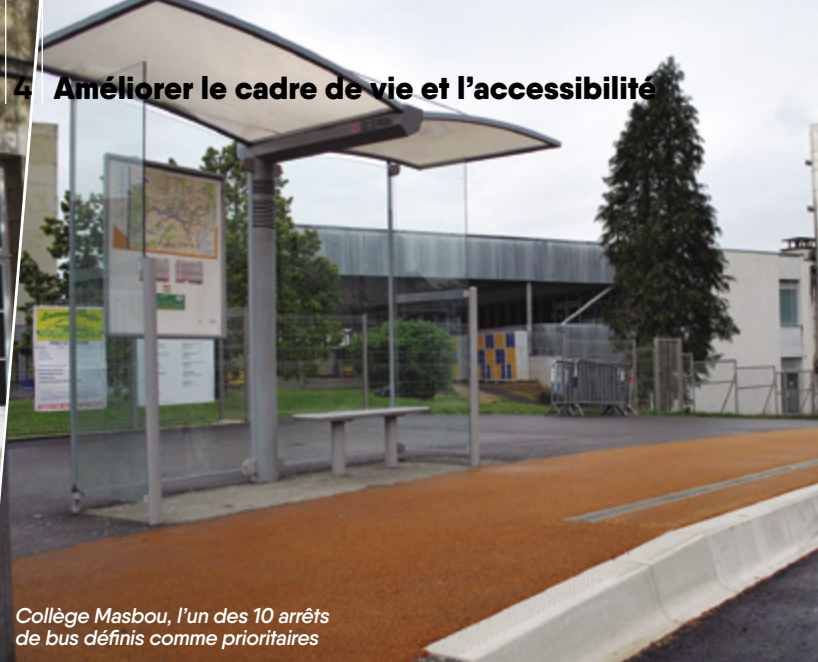
Collège Masbou, l'un des 10 arrêts de bus définis comme prioritaires