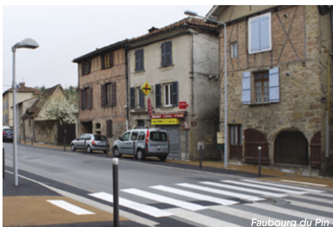
Faubourg du Pin