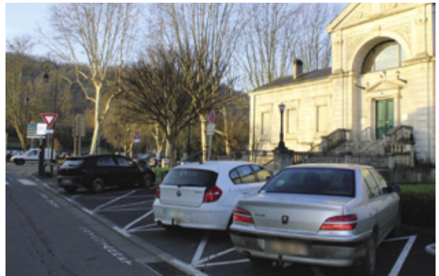
L'expérimentation « zone bleue » concerne notamment les 5 places « arrêt minute » situées face au tribunal. Pour y stationner, l'usage d'un disque réglementaire est obligatoire.

Les places concernées seront matérialisées au sol par des bandes de couleur bleue, complétées par une signalétique adéquate. Une fois l'expérimentation terminée, la Ville évaluera le dispositif pour éventuellement l'étendre à d'autres places de stationnement.