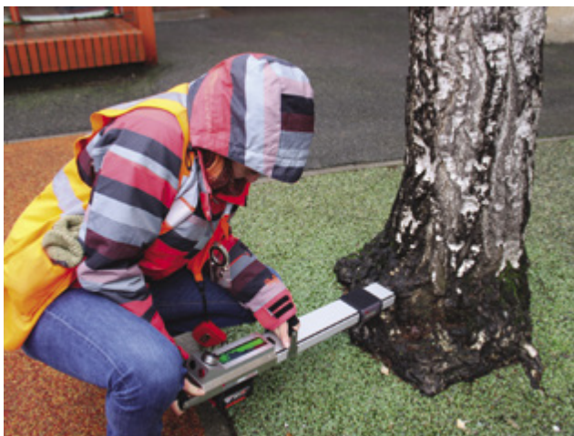
En janvier, l'entreprise Arbonautes a expertisé les arbres de 4 écoles. Ici, sondage réalisé au niveau du collet à l'aide d'un résistographe pour mesurer la profondeur de bois sain.