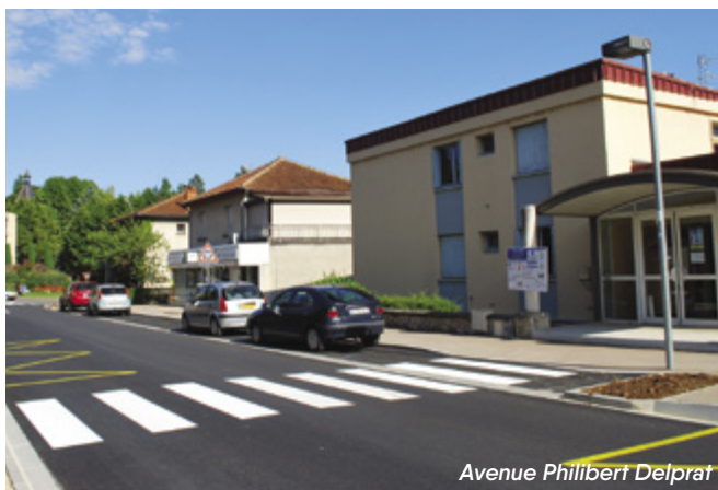
Avenue Philibert Delprat

Avec 90 places PMR aménagées sur 2344 places, Figeac affiche un taux de près de 4 % concernant les emplacements de stationnement PMR, soit 2 fois le ratio imposé par la loi.