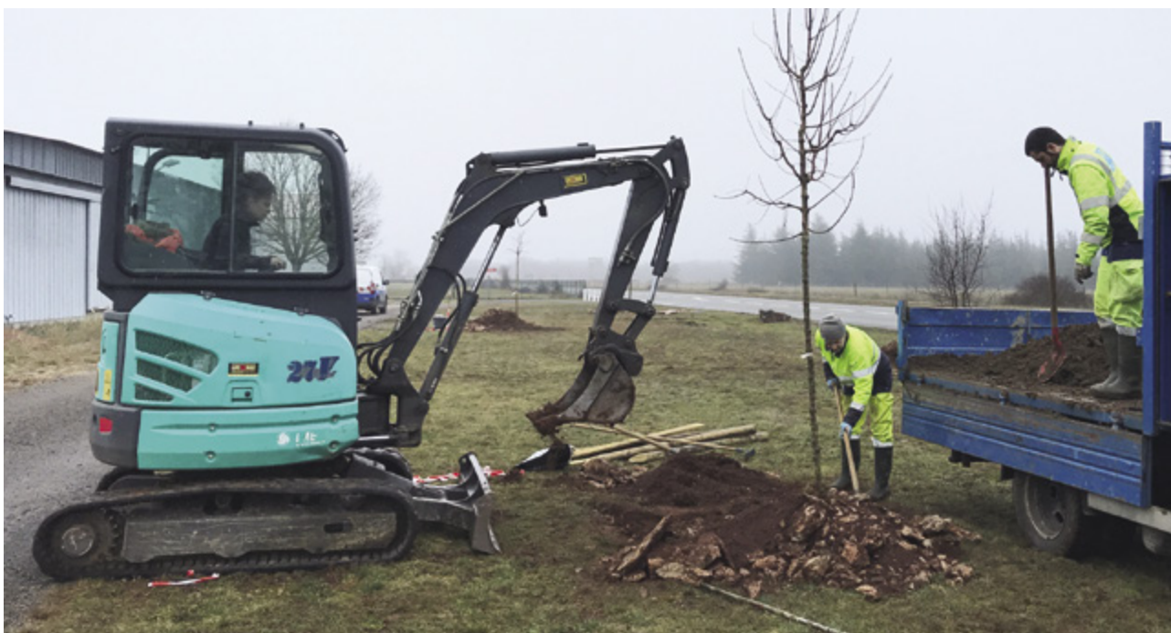
En début d'année, aux abords des pistes et des bâtiments de l'aérodrome, les agents communaux ont planté une quinzaine d'arbres.

En complément des élagages, une campagne annuelle est effectuée par des experts arboricoles pour assurer un suivi efficace. Objectifs : évaluer l'état de santé des arbres pour éviter tout risque, garantir au mieux leur pérennité en apportant les solutions préventives ou curatives adaptées. Là aussi, un cycle a été mis en place afin que chaque arbre soit analysé tous les 3 ans . Les abords des écoles, les places, rues et axes fréquentés sont ciblés en priorité mais l'ensemble du parc est concerné. Après une évaluation visuelle, un examen minutieux est effectué, des racines au houppier en passant par l'écorce.