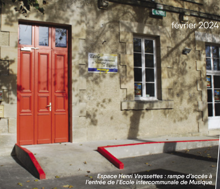
Espace Henri Vayssettes : rampe d'accès à l'entrée de l'Ecole intercommunale de Musique