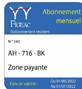
Proposition d'un visuel pour le macaron résident de la commune de Figeac – Iter Juin 2022